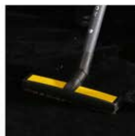
برس مخصوص فرش