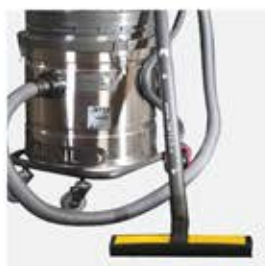
برس مخصوص سرامیک