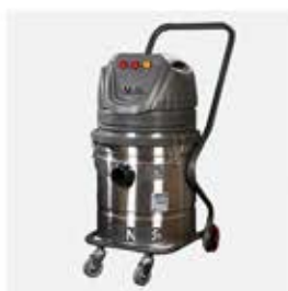
مخزن تمام استیل