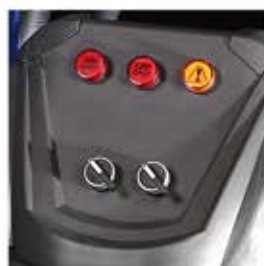
۲ موتور ۱۲۰۰ وات