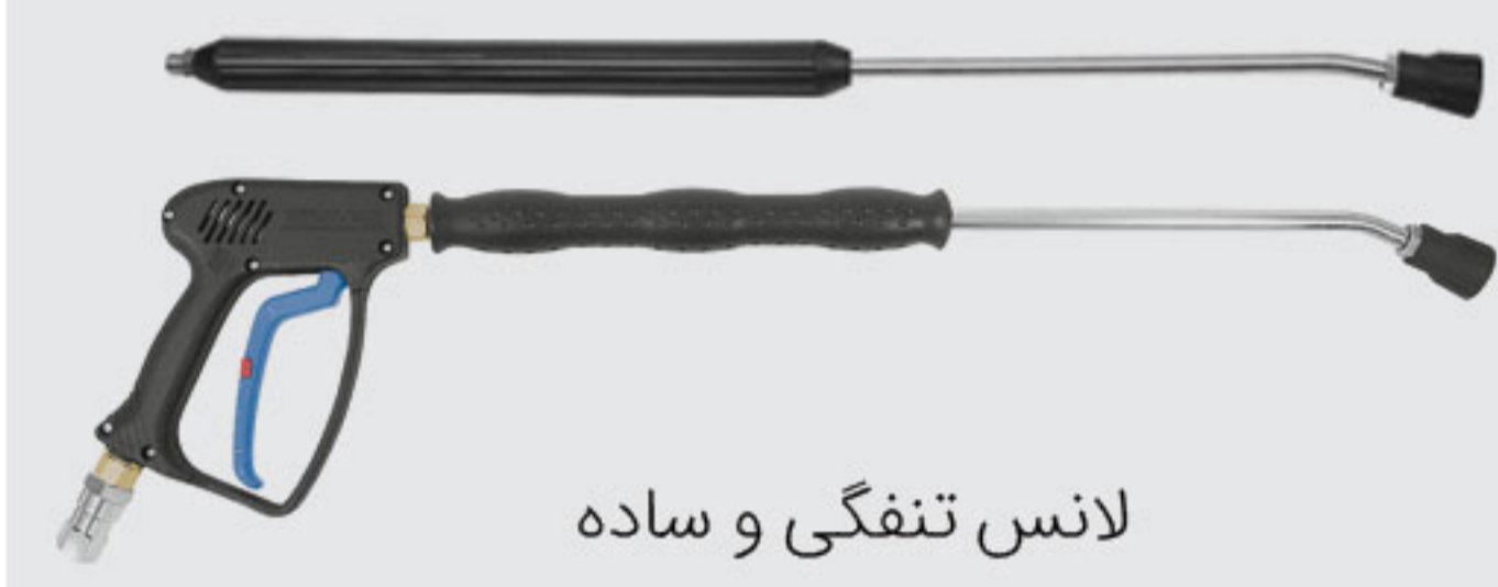
لانس تنگی و ساده